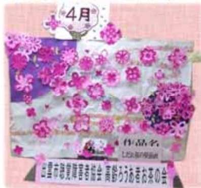
出雲市聴覚障害者協会高齢ろうあ者お茶の会の皆さん(出雲市)