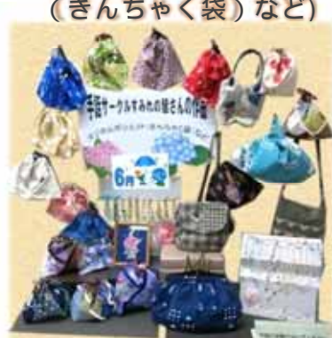
手話サークルすみれの皆さん(松江市)