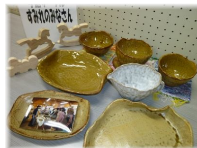
手話サークルすみれの 皆さんの作品