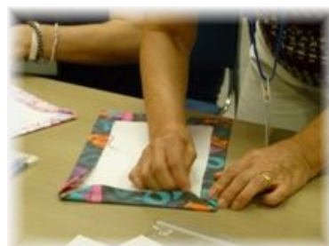
ミニホワイトボード作り↑

研修内容：新人研修 午前は講義を行い、午後は益田市中途失聴・難聴者協会の方にミニホワイトボード作りと、日頃感じておられる思いをお話いただきました。交流も図れ、充実した研修となりました。