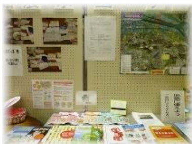
聴覚障害者のためのセミナー関連 「地震に備えよう」