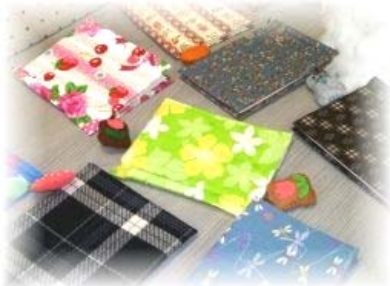
手話サークルすみれの皆さんの作品