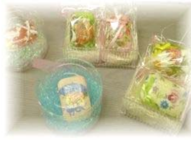
県ろうあ連盟女性部の皆さんの作品