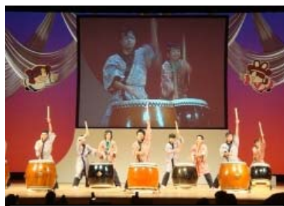
松江ろう学校太鼓部のみなさん

6日の午後から行われた、アトラクションのトップを飾ったのは、松江ろう学校の太鼓部の生徒さんによる 和太鼓の演奏でした。力強くすばらしい演奏でした。