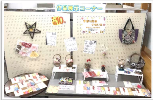
10月 「手作り作品 いろいろ」 手話サークルすみれ