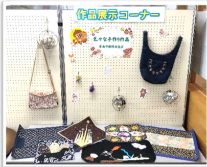
11月 「色々な手作り作品」 雲南市聴障者協会